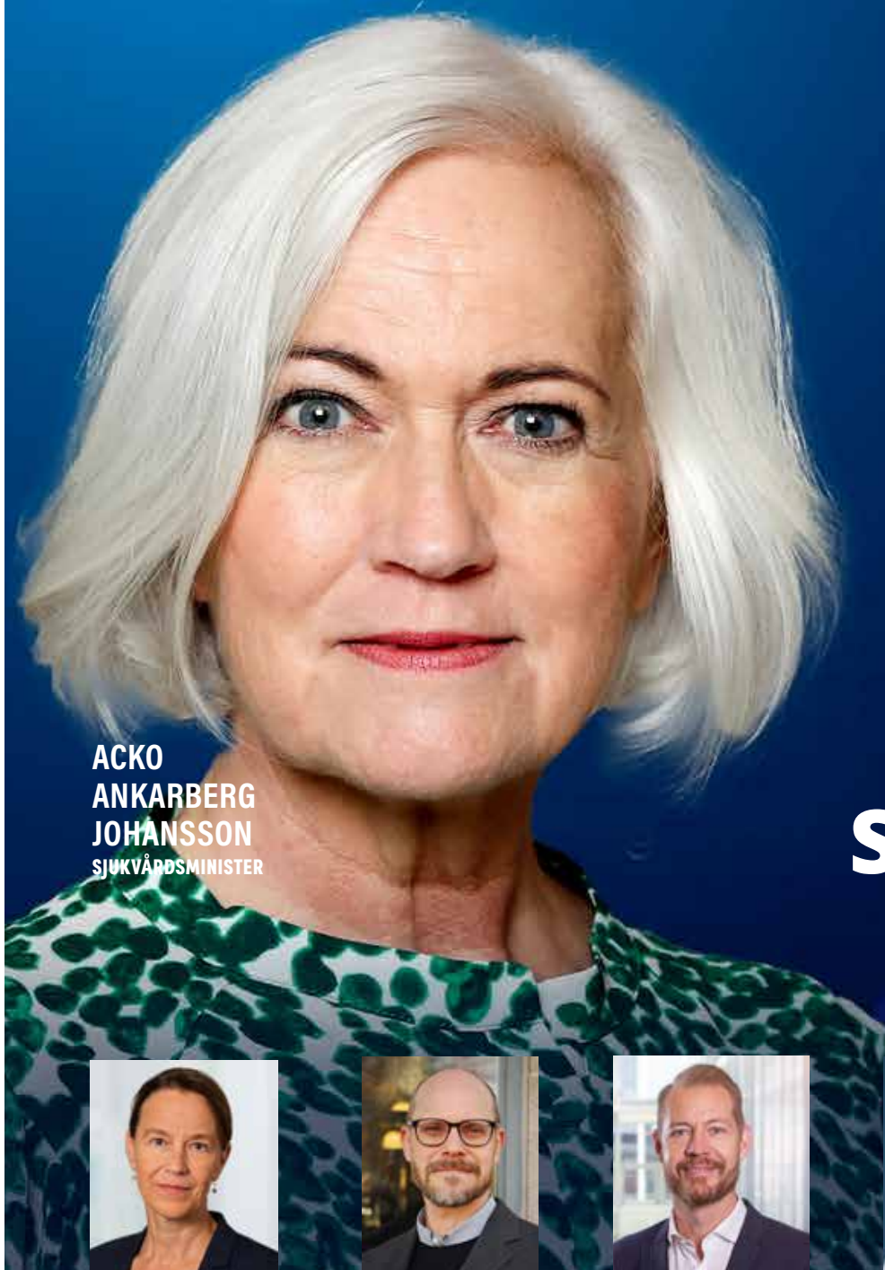
ACKO ANKARBERG JOHANSSON SJUKVÅRDSMINISTER