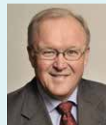
GÖRAN PERSSON , F.d. Statsminister