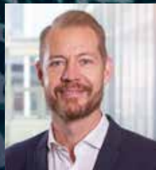
MAX HERULF STABSCHEF, E-HÄLSOMYNDIGHETEN