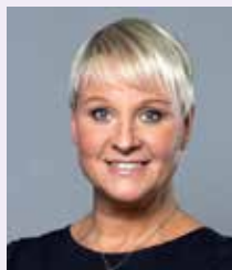
ANNA TENJE , äldre- och social- försäkringsminister