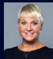
ANNA TENJE ÄLDRE- OCH SOCIAL- FÖRSÄKRINGSMINISTER