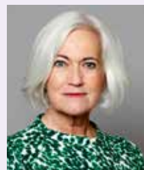
ACKO ANKARBERG JOHANSSON sjukvårdsminister