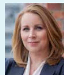
ANNIE LÖÖF , F.d. Näringsminister och partiledare